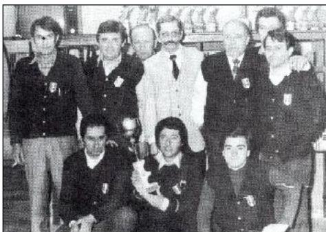
La formazione del Gabs Bar Pizzeria Rossoblu' di Faenza mattatrice del girone comprensoriale riservato ai cadetti

no come nei campionati di calcio. Per ogni squadra - cosa già avvenuta in passato - si sono avvicinati per ciascuna serata di gara ben 9 giocatori (3 singolaristi e 3 coppie) i quali, abbinati per sorteggio a quelli della squadra avversaria, hanno dato luogo a sei incontri per ogni turno. Per ciascuna partita è stato aggiudicato 1 punto per la classifica finale.