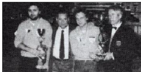
BENINI-LARDIERI campioni comprensoriali di FORLI'

Il C.R.I.B. (Centro Raccolta Italiana Biliardo)