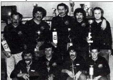
La squadra campione provinciale 1979-'80 del Gabs Hermelin Bar Belli di Ravenna vincitrice del girone d'eccellenza.

9° Campionato Ravennate Squadre 1979-'80. Questo torneo si è articolato su un girone di "eccellenza" composto da 16 team, e su un girone "comprensoriale" di Faenza, riservato alla seconda categoria, composto da 9 team con gironi di andata e ritor-