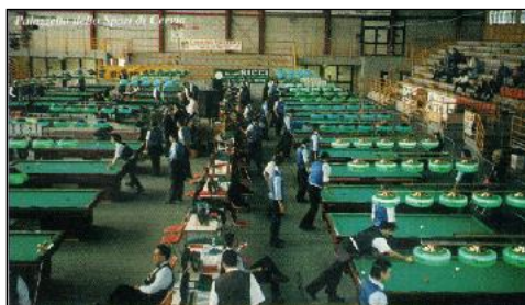
Veduta del Palazzetto dello Sport di Cervia (Ra)

Dal 28 aprile al 26 maggio presso il palazzetto dello sport di Cervia, un appuntamento da non mancare. E' in programma la sesta edizione del "Mese del Biliardo", competizione onnicomprensiva che tanti consensi ha riscosso negli anni passati. Le cifre parlano chiaro: 25 biliardi in sequela sul parquet (Artusi, De Blasi, Laffi, Mari, Ricci, Schiavon), oltre 3.000 tesserati impegnati per un totale di 35.000 partite, davanti ad un pubblico di appassionati stimato sulle 25.000 presenze nell'arco della competizione. Si assegneranno i titoli romagnoli e provinciali (Forlì-Cesena, Ravenna e Rimini) individuali, a coppie ed a squadre delle specialità bocchette e stecca. Inoltre, si disputeranno gare valide per l'assegnazione del titolo italiano di bocchette goriziana, di bocchette internazionali, e campionati italiani per categorie di bocchette maschili e femminili. La manifestazione gode del patrocinio del Comune di Cervia, e rappresenta un vero e proprio fiore all'occhiello delle innumerevoli iniziative sportive promosse dalla cittadina romagnola. La rivista "Biliardo Più" sarà presente all'attesissimo avvenimento con un proprio stand.