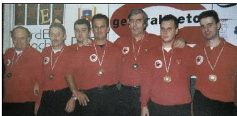
C.S.B. SAN QUIRICO di Firenze 3° classificata.