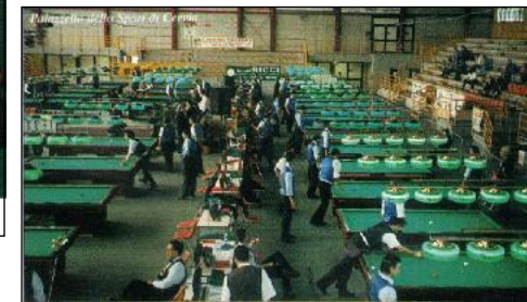
Veduta del Palazzetto dello Sport di Cervia (Ra)

Dal 28 aprile al 26 maggio presso il palazzetto dello sport di Cervia, un appuntamento da non mancare. E' in programma la sesta edizione del "Mese del Biliardo", competizione onnicomprensiva che tanti consensi ha riscosso negli anni passati. Le cifre parlano chiaro: 25 biliardi in sequela sul parquet (Artusi, De Blasi, Laffi, Mari, Ricci, Schiavon), oltre 3.000 tesserati impegnati per un totale di 35.000 partite, davanti ad un pubblico di appassionati stimato sulle 25.000 presenze nell'arco della competizione. Si assegneranno i titoli romagnoli e provinciali (Forlì-Cesena, Ravenna e Rimini) individuali, a coppie ed a squadre delle specialità bocchette e stecca. Inoltre, si disputeranno gare valide per l'assegnazione del titolo italiano di bocchette goriziana, di bocchette internazionali, e campionati italiani per categorie di bocchette maschili e femminili. La manifestazione gode del patrocinio del Comune di Cervia, e rappresenta un vero e proprio fiore all'occhiello delle innumerevoli iniziative sportive promosse dalla cittadina romagnola. La rivista "Biliardo Più" sarà presente all'attesissimo avvenimento con un proprio stand.