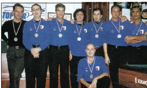
C.S.B. Bar SPORT di Finale Ligure 2° classificata.